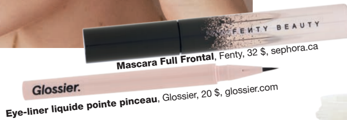
Mascara Full Frontal, Fenty, 32 $, sephora.ca

Notre verdict: La brosse du mascara, plate d'un côté et bombée de l'autre, recourbe efficacement les cils, alors que la formule, modulable, permet de passer d'un look naturel à dramatique en quelques couches. En ce qui concerne le traceur, il répond aux attentes sur toute la ligne. Un must!